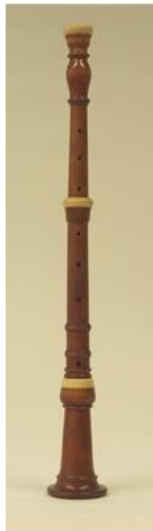
Auboi