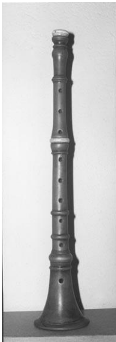
Le hautbois du Bas-Languedoc

Hautbois de Puechabon recueilli par Pierre Laurence et Michel Vidal