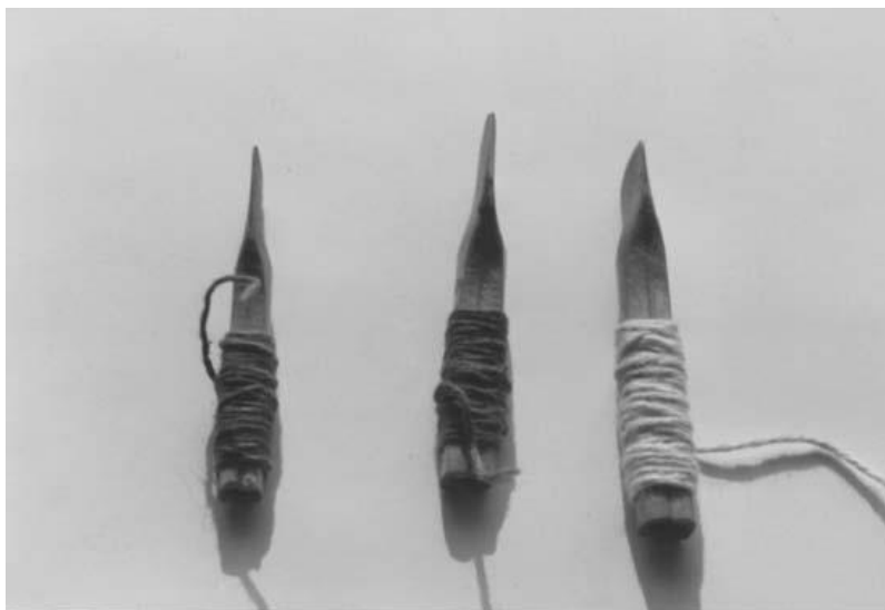
Photo 2 : Anches creusées vues de profil (les deux lamelles sont attachées)