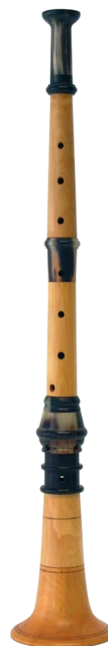
Graile Coll. COMDT

Graile recueilli en 1984 à Colomiers (31) par Luc Charles-Dominique (Conservatoire Occitan) auprès de Mme Camp.