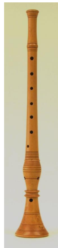
Hautbois dit de Vailhourles Coll. COMDT

Le hautbois d'écorce mesure généralement entre 70 et 80 cm. Au cône en écorce s'ajoute toujours une forme d'anche, le plus souvent un sifflet 14 . Ce sifflet se change à chaque utilisation de l'instrument.