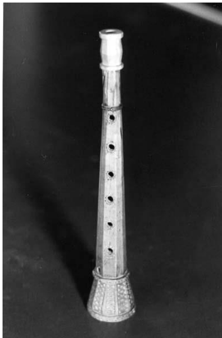
Clarin du musée de Lourdes (65)