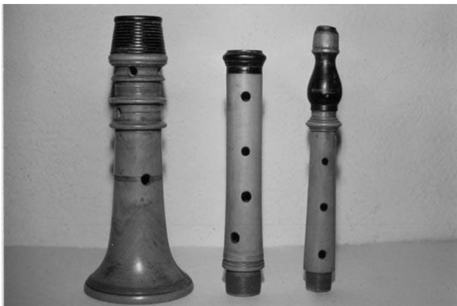
Les trois parties du graile