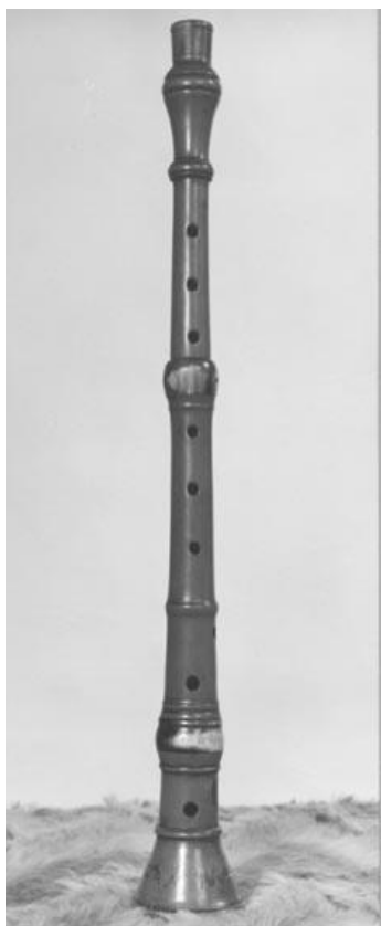
Aboès, hautbois du Couserans

« [...] l'aboès, hautbois traditionnel du Couserans, grand hautbois de 53 cm en trois parties, dont on doit la conservation dans cette petite région des Pyrénées gasconnes à la précocité étonnante des groupes folkloriques couserannais (celui de Bethmale a été fondé en 1906). Le répertoire de cet instrument est surtout constitué de mélodies destinées à accompagner la danse couserannaise. L'un des derniers fameux ménétriers de cet instrument, surnommé Pigalhe 5 , fait encore figure de légende. »